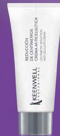
KRÉM REDUJÍCÍ CELULITIDU A CENTIMETRY

Krém s výbornou kluzností, který zvyšuje lipolýzu. Podporuje mikrocirkulaci a pomáhá eliminovat toxiny.