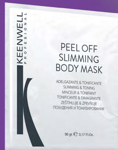
PEEL OFF TĚLOVÁ MASKA ZEŠTÍHLUČJÍ & ZPEVNŮJÍCÍ

Maska kombinující algináty a bylinné výtažky. Aktivuje lipolýzu, podporuje vylučování toxinů a zpevňuje tkáň.