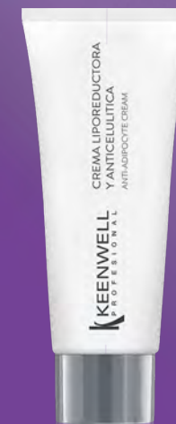
LIPOREDUKČNÍ KRÉM PROTI CELULITIDĚ

Krém s výjimečnou kluzností pro masáž problematických partií. Má i výrazný hydratační účinek, nedráždí a snižuje ukládání tuku.