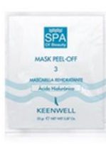
Vysoce hydratační slupovací maska s kyselinou hyaluronovou KÓD: kit