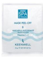
Antioxidační zesvětlující maska s vitamínem C KÓD: K4726001