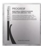
PROGRESIF PROFESIONAL – Zklidňující liftingový maska proti vráskám kolem očí KÓD: kit